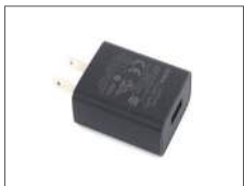
อะแดปเตอร์ (USB)