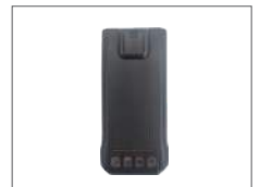
แบตเตอรี่ 2000mAh BL2021