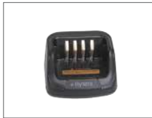
เครื่องชาร์จเร็ว MUC