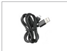
สายตาค้า PC 143