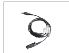
สายโปรแกรม PC155