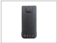
แบตเตอรี่ 1500mAh