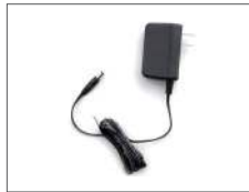
อะแดปเตอร์