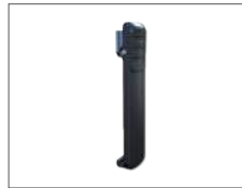
คลิปหนีบเข็มขัด