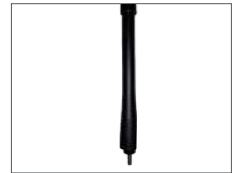
สายอากาศ